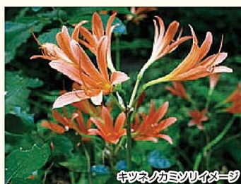
キツネノカミソリイメージ