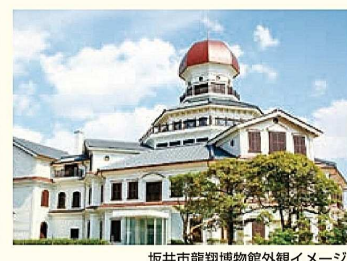
坂井市龍翔博物館外観イメージ