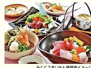
みくにうまいもん膳昼食イメージ

◎三国のシンボルタワーのひとつ・坂井市龍翔博物館ああの建物の中はどんなってるの?そんなあなたのギモン解決!