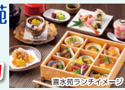
喜水苑ランチイメージ

【行程】30分 見学 浅野太鼓楽器店・豊富な種類の太鼓を見学(試打OK) 70分 昼食 料亭 喜水苑 内容 平日限定ランチ 140分 鑑賞&体験 石川県立音楽堂・踊りや太鼓お座敷遊びの特別公演&舞台機構や花道、奈落見学など