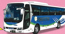
添乗員付でご案内します