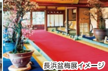
長浜盆梅展イメージ