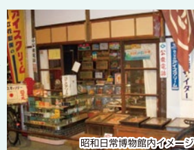
昭和日常博物館内イメージ