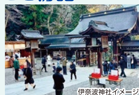
伊奈波神社イメージ