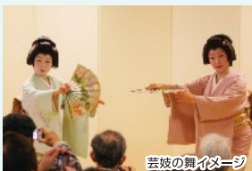
芸妓の舞イメージ