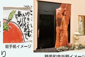
額美和食外観イメージ