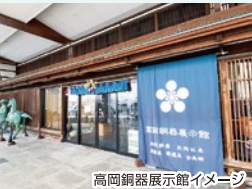
高岡銅器展示館イメージ