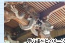
手力雄神社イメージ

【行程】各地＝手力雄神社参拝＝馬喰 一代(昼食)＝大和屋守口漬特別体験＝ (株)関ヶ原マープルクラフト展示場見学＝各地 (武生 17:50～福井 19:00頃着)