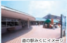
道の駅みくにイメージ