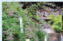
梨木神社イメージ

【行程】各地＝智積院僧侶による案内付 拝観(昼食)＝梨木神社参拝＝京つけもの 大安＝各地(武生 18:20～福井 19:30頃着)