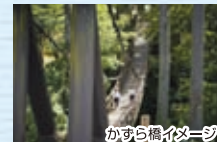
かずら橋イメージ