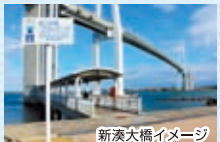
新湊大橋イメージ