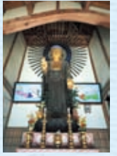
寺谷大仏イメージ

◆コースNo.3◆ ◆昼食は、はま郷さんのお弁当です◆ 夏探検! たべごろベリーと 三国いいところ 行ってこさ