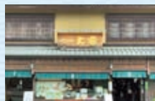
京つけもの 大安イメージ