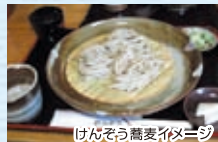
けんそう蕎麦イメージ

◎6月25日に企画するも自粛してお流れになったけんそう蕎麦訪問。福井を代表する逸品、ここにあり ◎旧内山家では「夏障子」を、旧田村家では512個の「風車欄」をご覧いただき大野の夏の風物詩としてカメラにお収め下さい。