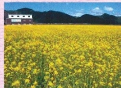
さばえ菜花イメージ

お問合わせ・お申込は 0778-21-1120 福鉄会員募集予約センターまで 運行会社：福井鉄道株式会社