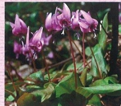
カタクリイメージ