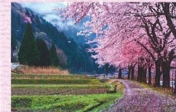
くつきの桜イメージ

【行程】各地＝くつきの桜(散策・約60分・里山の桜風景ご覧あれ)＝道の駅「藤樹の里あどがわ」(お買物・約90分・近江牛すきやき御膳をご用意)＝新旭風車街道(車窓より桜風景・約6k)＝海津大崎(車窓より桜風景約4k)＝余呉湖(散策・約60分・湖畔の桜お花見)＝各地(武生 18:00～福井 19:00頃着)