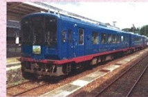
のと鉄道イメージ