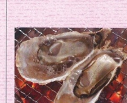
のどがきイメージ

【行程】各地＝かき浜(散策・約90分・あつあつジュシーふっくら春がきをフルコースでいただきます)＝のと鉄道(スイーツ列車乗車・約70分・穴水駅〜七尾駅のどかな風景を眺めながら能登出身のバティエ工社ロビープロデュースのスイーツをいただきます)＝能登食祭市場(お買物・約30分・お買物はこちらで!!)＝各地(福井 18:40～武生 19:40頃着)