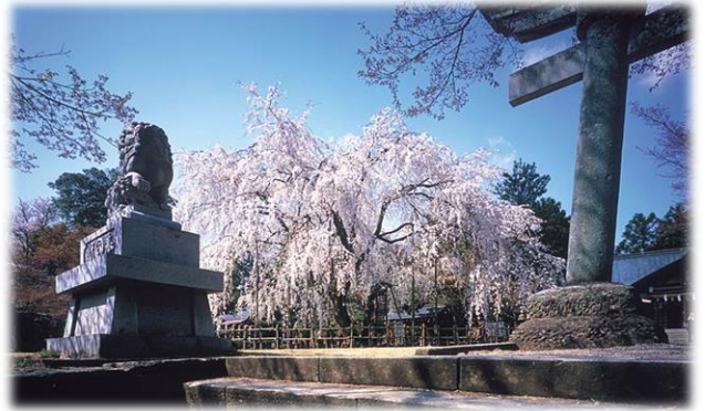
足羽神社 しだれ桜