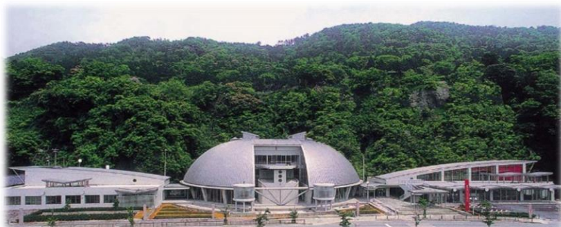
越前かにミュージアム